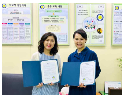
서울송중초등학교 협약 (2024년 7월 8일)