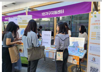
'강북구 양성평등주간행사' 1인가구지원센터 홍보 2024년 9월 4일