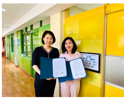
서울화계초등학교 병설유치원 협약 (2024년 6월 20일)