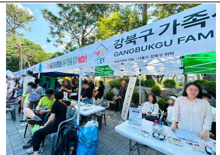
'강북구 한마음걷기 FESTA' 가족센터 홍보 2024년 6월 26일