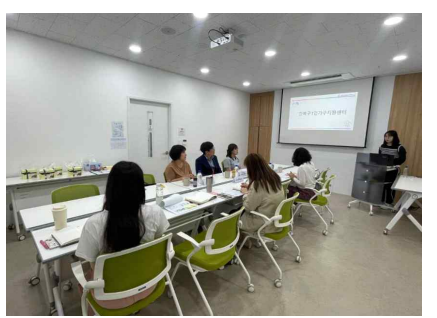
1인가구지원센터 자문위원회 회의 진행 (2024년 6월 4일)