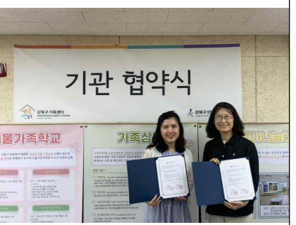
강북여성인력개발센터 협약 (2024년 8월 30일)