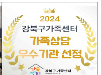
가족상담 우수기관 선정