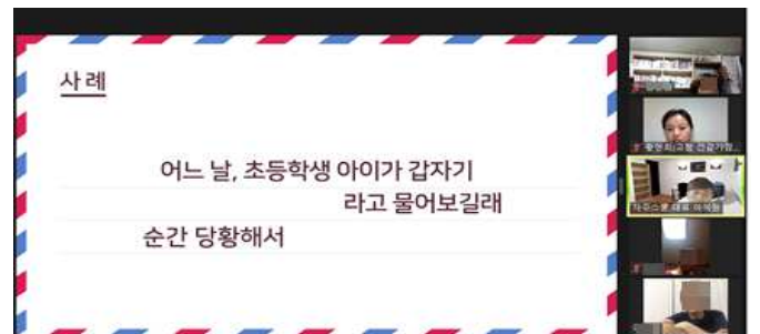
<줌 교육 화면>

센터는 9월 23일, 27일 초등 자녀를 둔 부모를 대상으로 성교육을 진행했다. 교육에서는 자녀들의 몸의 변화에 대해 부모들이 어떻게 대처해야 하는지, 자녀들의 음란물 접근을 어떻게 예방해야 하는지 등에 대해 배울 수 있었다. 참가자는 "아이들이 성과 관련된 질문을 하면 난처하고 대답하기가 곤란해 피했던 것 같다. 앞으로는 피하지 말고 관련 지식을 정확하게 알려주며 성교육에 대해 좀 더 열린 마음으로 대화해야겠다."고 소감을 전했다.