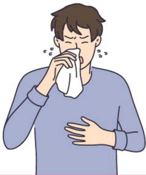
មានកូនរូបក្អក ក្អាយ ក្អាត ហ្វឹក ហ្វឺត