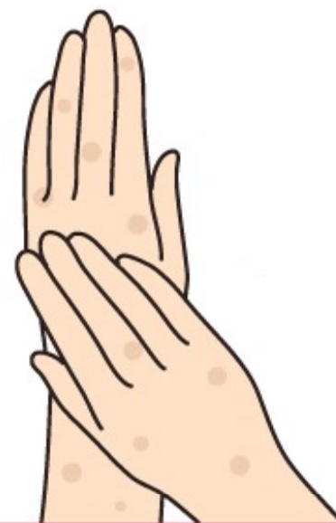
ពេញខ្លួនកន្ទួលហាក់ ហើយបន្តសល់