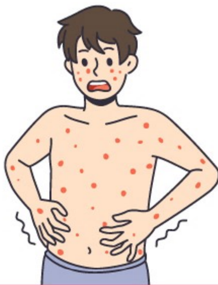
កន្ទួលកូនរូបលេចឡើងនៅជុំវិញ