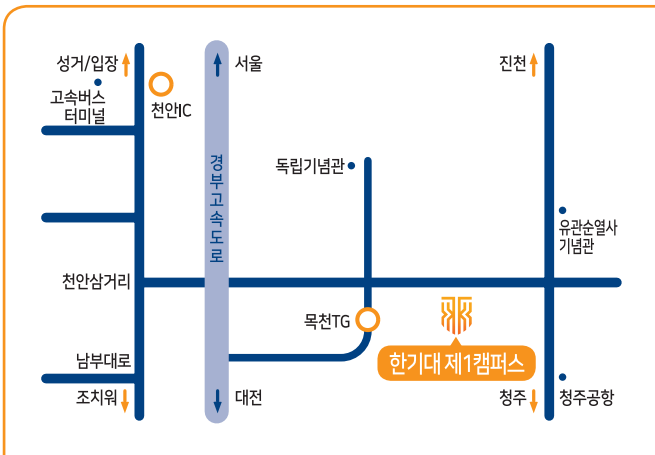
1캠퍼스 충청남도 천안시 동남구 병천면 충절로 1600