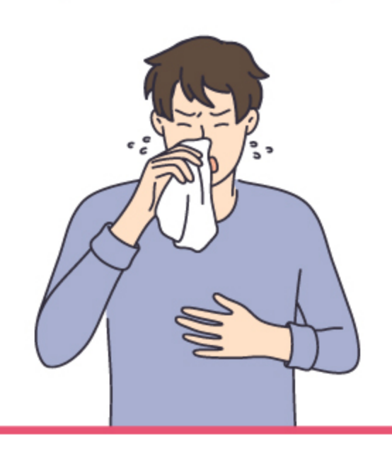
传染力最强的时期, 出现发热、咳嗽、流鼻涕、结膜炎、 口腔内斑点等